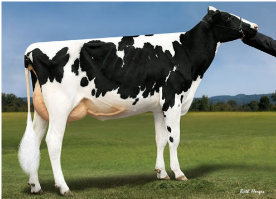
PROGENESIS JETT CATENA DAM